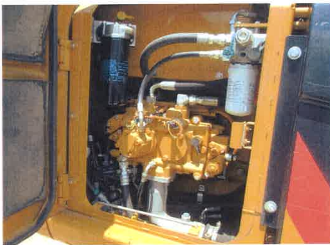
右サイドカバー内部