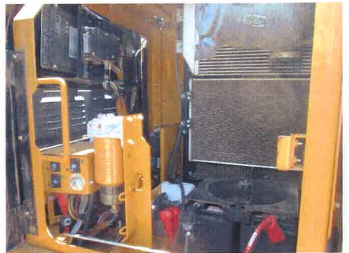
左サイドカバー内部