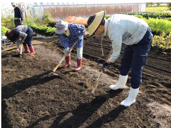
クワでの整地の様子

次回は、令和 2 年 10 月 16 日(金)、17 日(土)に「農作業安全」について、実際にトラクターや管理機を使用しながら研修します。