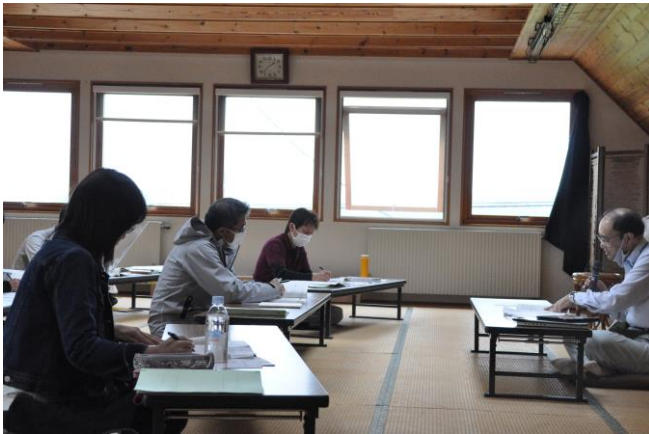
「気象と水稲」についての講義の様子

次回は、令和2年7月10日(金)・11日(土)に「栽培基礎(土壌的要素)」について学ぶ予定です。