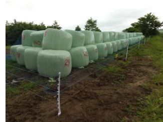
INKとは、岩手県(I)農業(N)公社(K)の略称

規格 Φ115cm × H100cm 重量 平均740kg 水分 70～83% 生産地 八幡平市七時雨、雫石町南畑