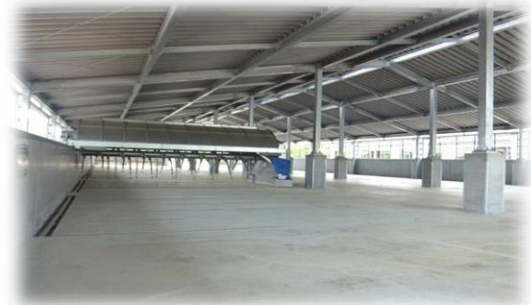
堆肥処理施設内部(洋野町)