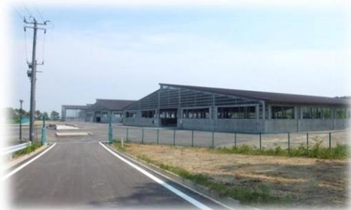
堆肥処理施設外観(洋野町)