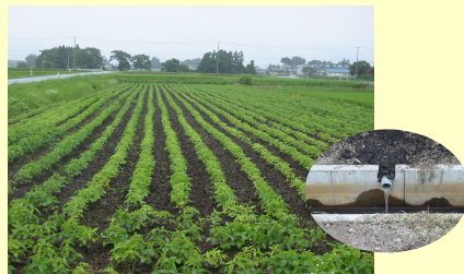
☆補助暗渠施工済地(石鳥谷町)

補助暗渠を施工した水田では、10a 当り 280kg~300kg 以上の大豆収量となっています。(H12 農業研究センタ-調査結果)