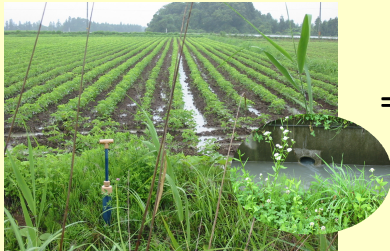
☆補助暗渠未施工地(胆沢町)